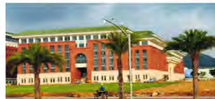
中山大学珠海校区海洋科学学院楼(富海侧)

目前施工进度情况：工程已通过竣工验收，下一步进入工程质量保修期阶段，准备移交中山大学珠海校区。