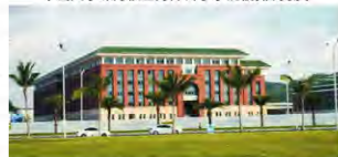
中山大学珠海校区海洋科学学院楼(临港湾大道侧)